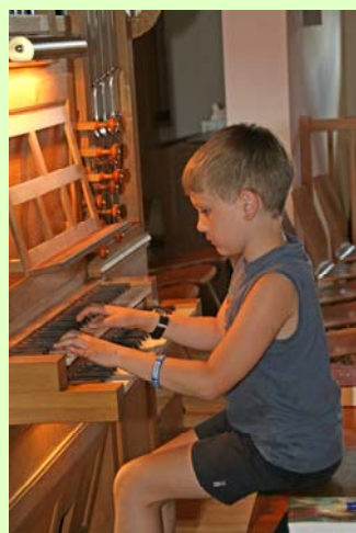
An der Übeorgel des Mozarteums