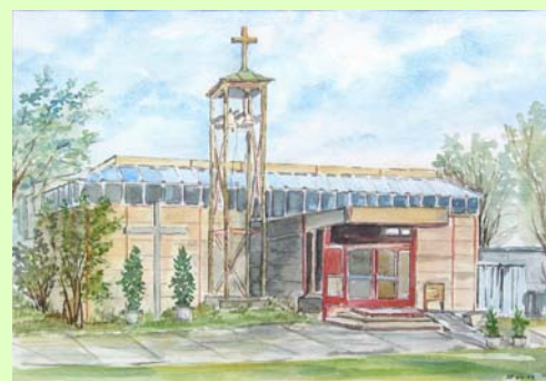
Pfarrzentrum St. Paul 1972-93

1993/94 wurde das neue Pfarrzentrum mit Kirche und angeschlossenem Pfarrzentrum errichtet, geplant vom Architekturbüro Dipl. Ing. Erio K. Hofmann, in Zusammenarbeit mit Arch. Dipl. Ing. Adalbert Rothenthal. Eine transparente Architektur prägt das Gebäude. Ein hoher Anspruch zeichnet die künstlerische Gestaltung der Kirche aus. Die Fenster und Türen stammen von Richard Hirschbäck. Der Altarraum der Kirche wurde von Hubert Schmalix gestaltet.