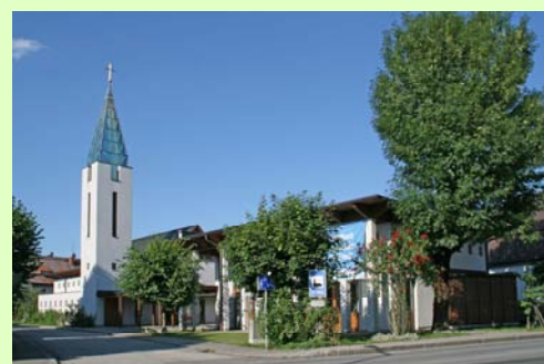
Pfarrzentrum, errichtet 1993/94